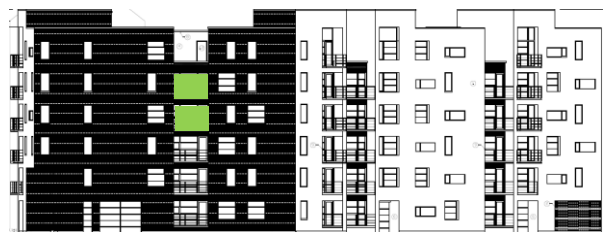
Gatufasad mot sydost