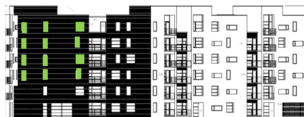
Gatufasad mot sydost