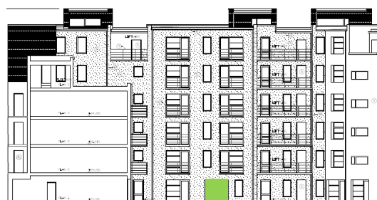
Gårdsfasad mot väster