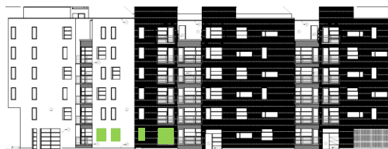
Gatufasad mot öster