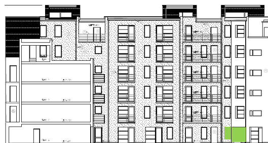
Gårdsfasad mot väster