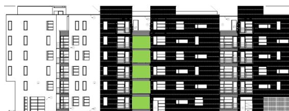
Gatufasad mot öster