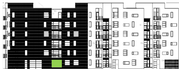
Gatufasad mot sydost