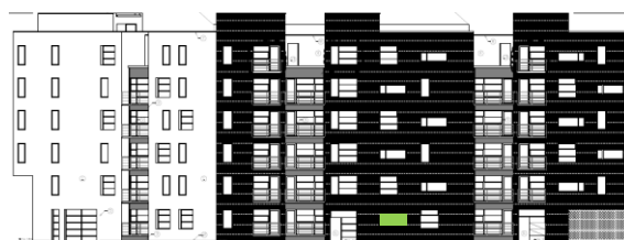
Gatufasad mot öster