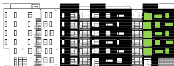
Gatufasad mot öster