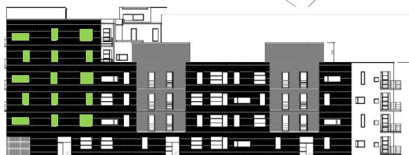
Gatufasad mot norr