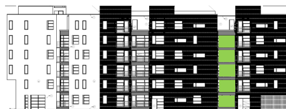
Gatufasad mot öster