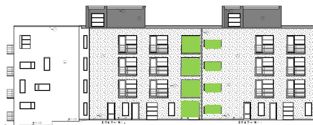
Gårdsfasad mot söder