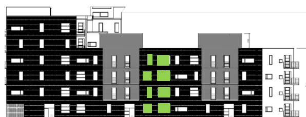
Gatufasad mot norr