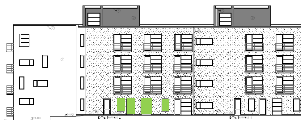
Gårdsfasad mot söder