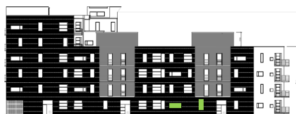
Gatufasad mot norr