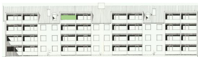
Vy mot söder