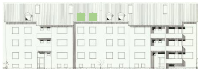
Vy mot öster