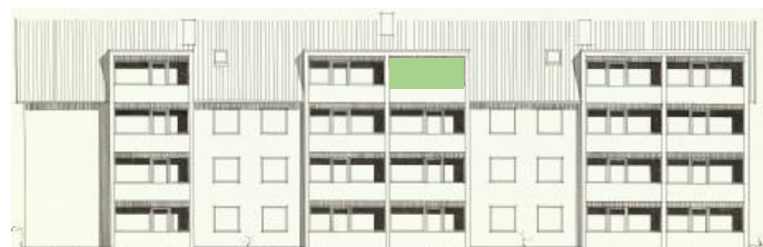
Vy mot väster