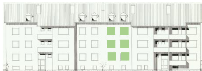
Vy mot öster