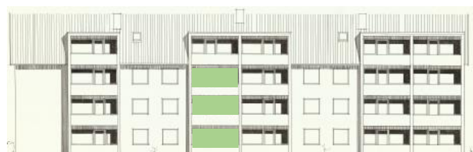
Vy mot väster