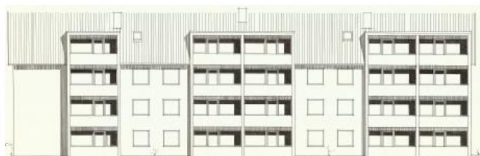
Vy mot väster