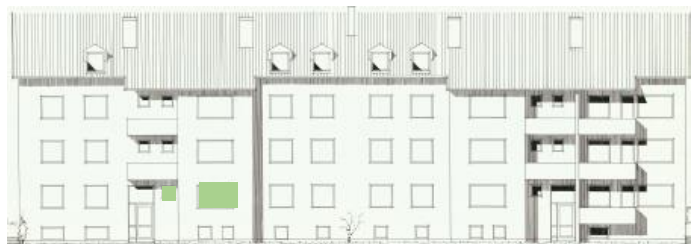
Vy mot öster