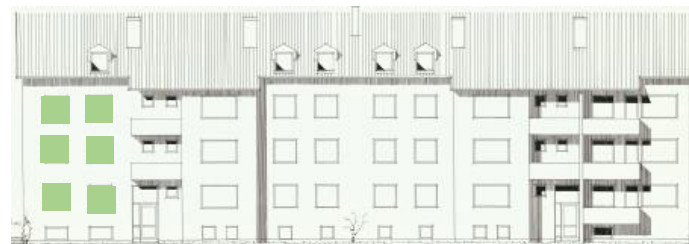
Vy mot öster