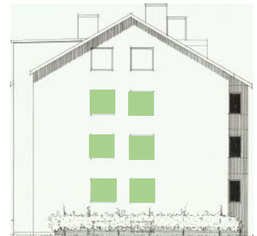
Vy mot söder