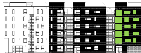
Gatufasad mot öster