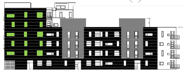
Gatufasad mot norr