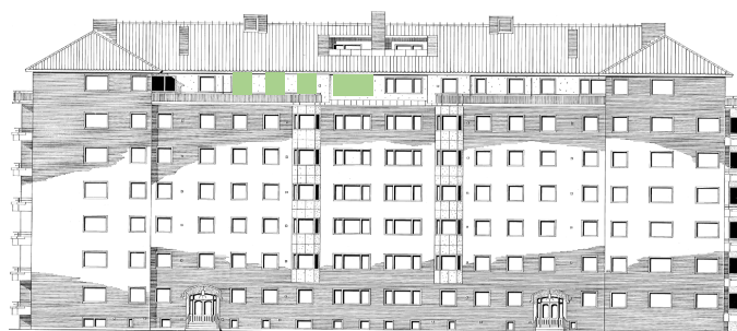
Vy längs Sergelsväg