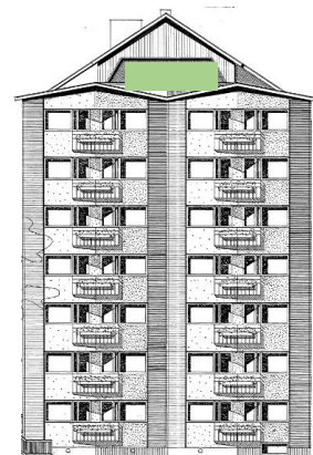
Vy mot norr