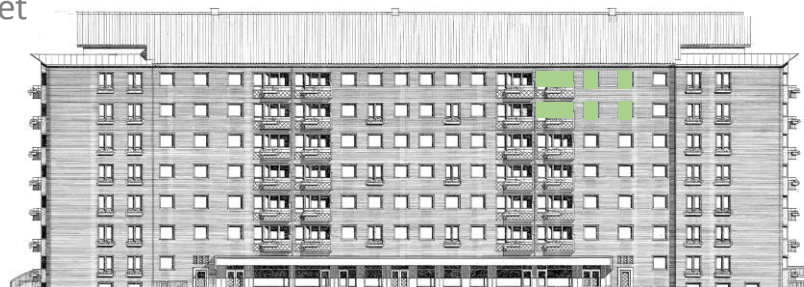
Vy längs Sergelsväg