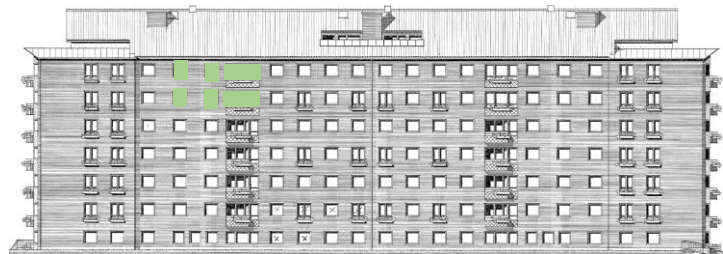
Vy längs innergård (öster)