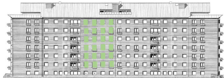
Vy längs innergård (öster)