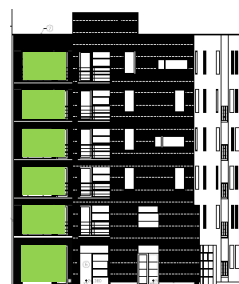
Gatufasad mot söder