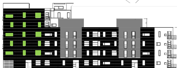
Gatufasad mot norr