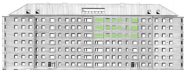
Vy mot öster