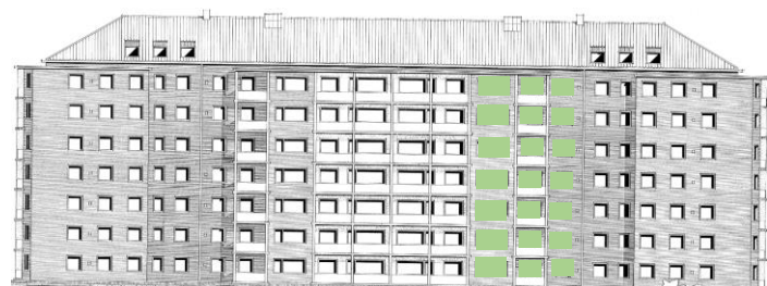
Vy mot väster