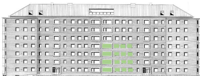
Vy mot öster