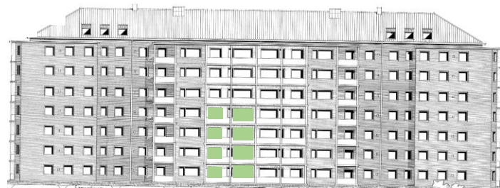
Vy mot väster