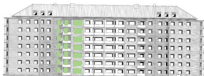
Vy mot väster