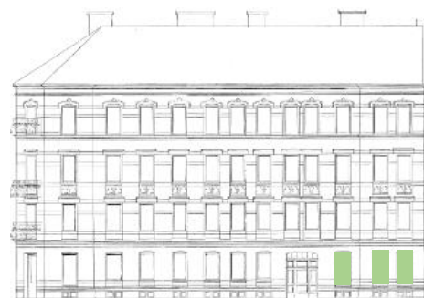
Vy mot öster