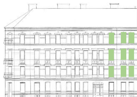
Vy mot öster