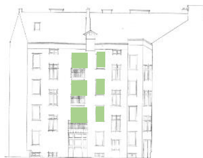
Gårdsfasad mot väst