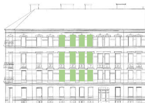
Vy mot öster