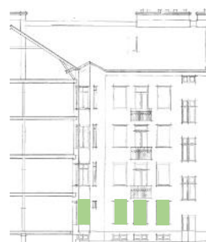
Gårdsfasad mot öster