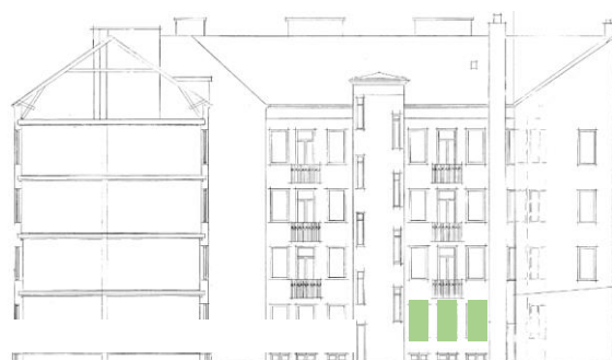
Gårdsfasad mot norr