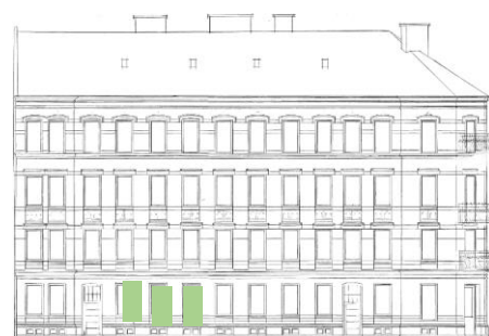
Vy mot syd