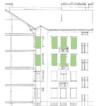
Gårdsfasad mot öster