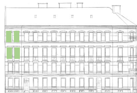
Vy mot syd