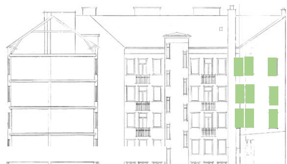
Gårdsfasad mot norr