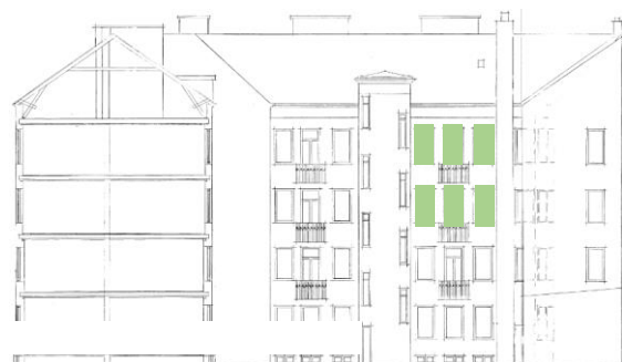
Gårdsfasad mot norr