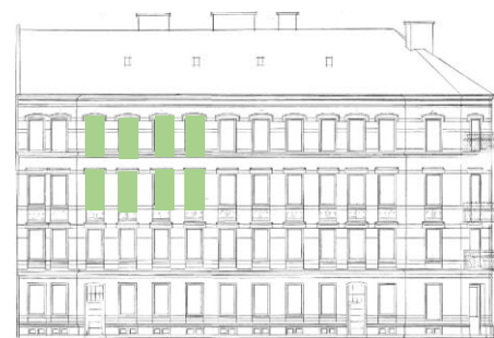
Vy mot syd