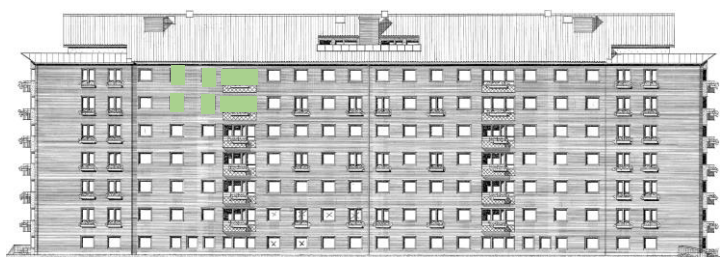
Vy längs innergård (öster)