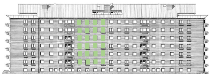
Vy längs innergård (öster)