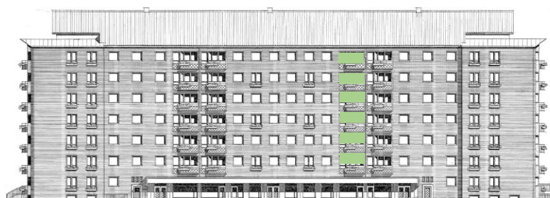
Vy längs Sergelsväg