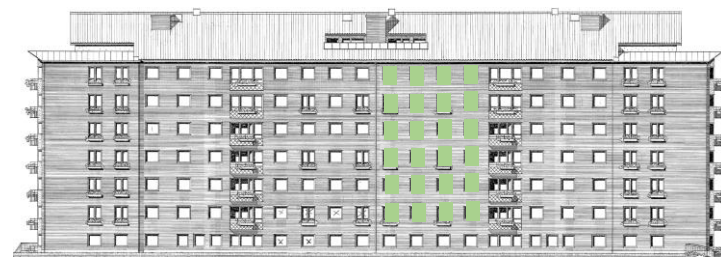
Vy längs innergård (öster)