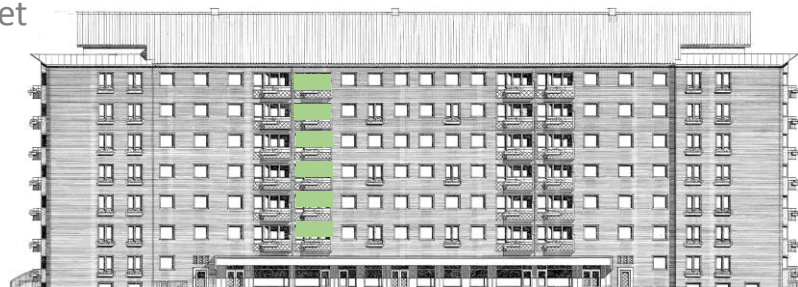
Vy längs Sergelsväg