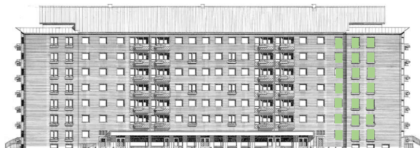
Vy längs Sergelsväg