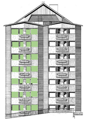
Vy mot söder