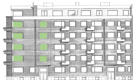
Vy mot sydost (Södra Promenaden)