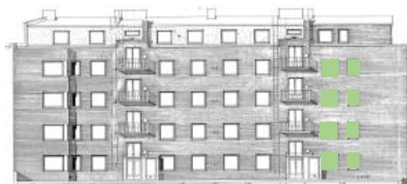
Vy mot nordväst