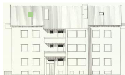
Vy mot öster