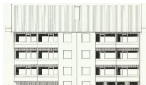
Vy mot väster