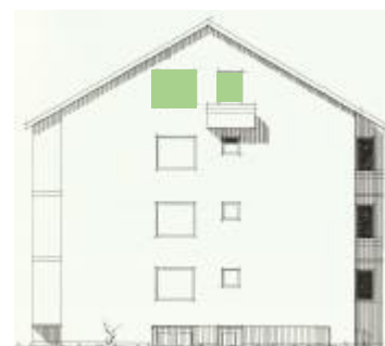
Vy mot söder