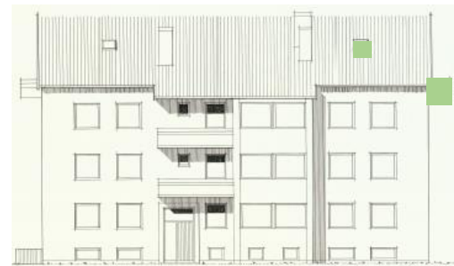
Vy mot öster