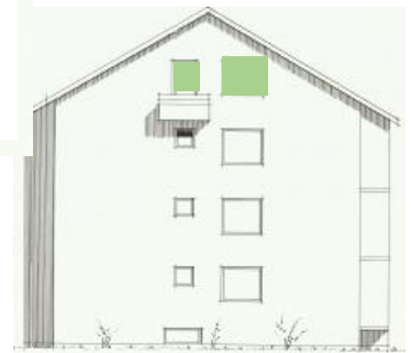
Vy mot norr