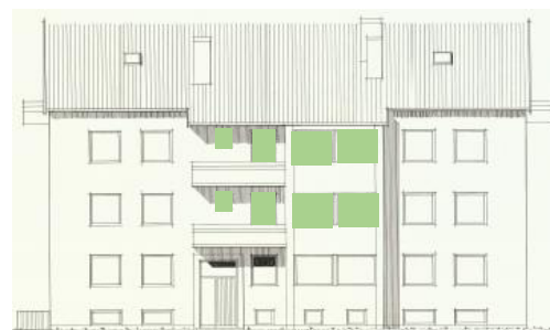
Vy mot öster