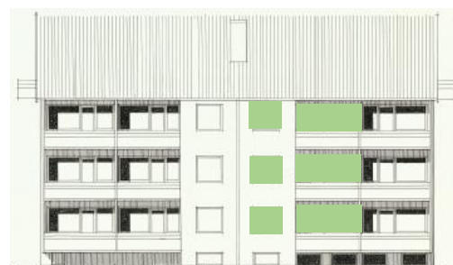
Vy mot väster