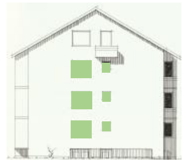
Vy mot söder