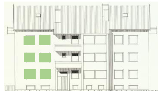
Vy mot öster