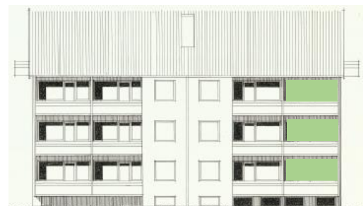
Vy mot väster