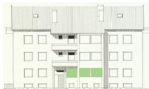
Vy mot öster