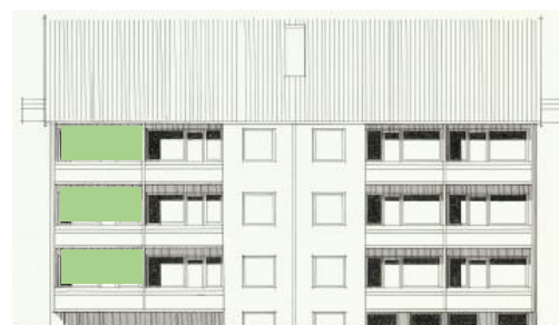
Vy mot väster