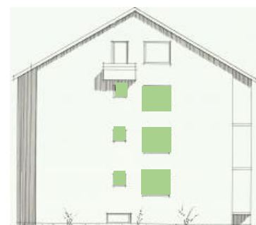
Vy mot norr