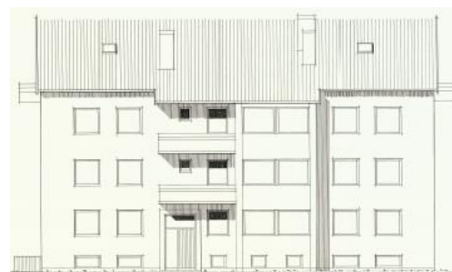
Vy mot öster