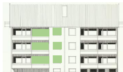
Vy mot väster