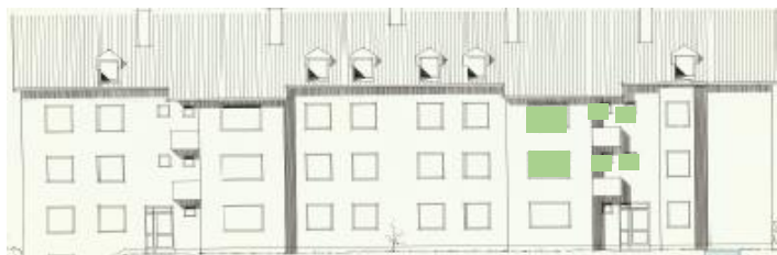
Vy mot öster