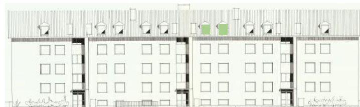
Vy mot norr