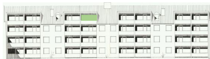
Vy mot söder