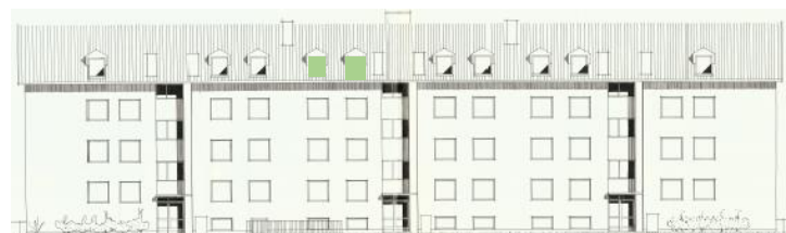
Vy mot norr